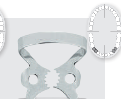
# 2T REF 52253 Wie # 2 mit Micro- verzahnung für verbesserten Halt am Zahn as # 2 with micro serration for better grip on the tooth