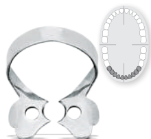
# 00 REF 52208 Für kleine Prämolaren mit dünnem Zahnhals und Frontzähne for small premolars with thin neck and anterior teeth