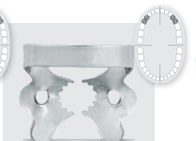
# 1T REF 52251 Wie # 1 mit Micro- verzahnung für verbesserten Halt am Zahn as # 1 with micro serration for better grip on the tooth