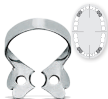
# 0 REF 52210 Für Prämolaren mit dünnem Zahnhals for premolars with thin tooth neck