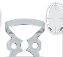
# 2 REF 52213 Für untere Prämolaren for lower premolars