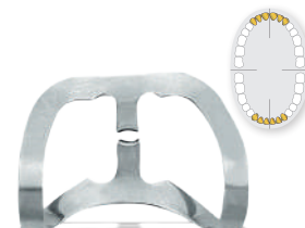
# 212 REF 52202 Für labiale Karies for labial caries