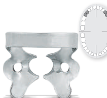
# 1 REF 52211 Für obere Prämolaren for upper premolars